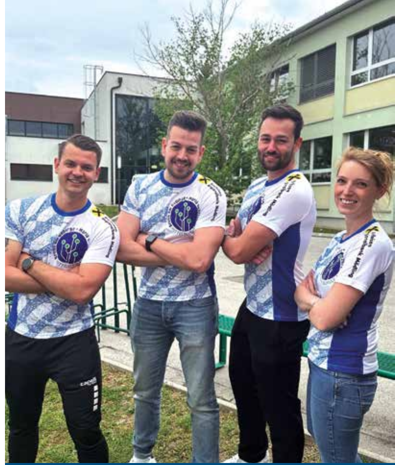
Mit den neuen Laufshirts der Raika war die Teilnahme am Wien-Marathon für die Lehrkräfte der Mittelschule Brunn-Maria Enzersdorf doppelt so schön!

Die Teilnahme am Wien-Marathon war für Lehrerinnen und Lehrer nicht nur eine sportliche Herausforderung, sondern auch die Gelegenheit, sich für ein gemeinsames Ziel einzusetzen und ein positives Vorbild für ihre Schülerinnen und Schüler zu sein.