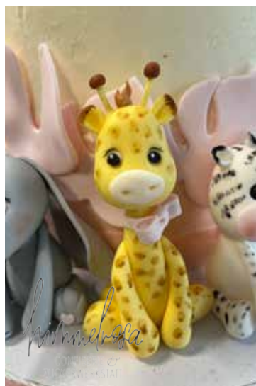
Individuelle Torten für jeden Anlass Mehr Infos auf www.himmelrosa.at

Mit der BrunnCard erhalten Sie 3 % Rabatt bei einem Einkauf ab € 20,- im Geschäft.